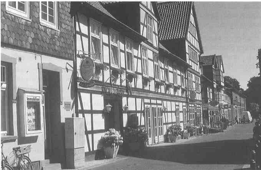
Abb. 1: Lüchow: versiegelte Altstadt (Burgstraße), Mai 2001.