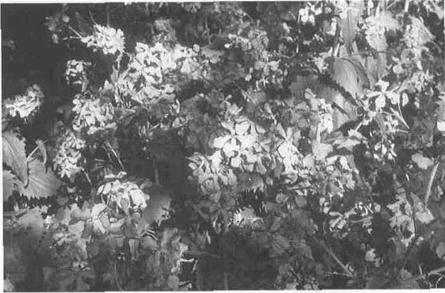
Abb. 6: Lunaria annua -Verwilderungen in einem aufgelassenen Garten am südlichen Stadtrand. Mai 2001.