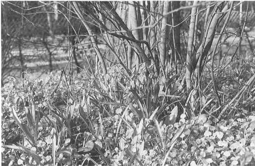
Abb. 3: Scilla siberica -Verwilderungen auf dem ehemaligen St.-Annen-Friedhof. April 2001.