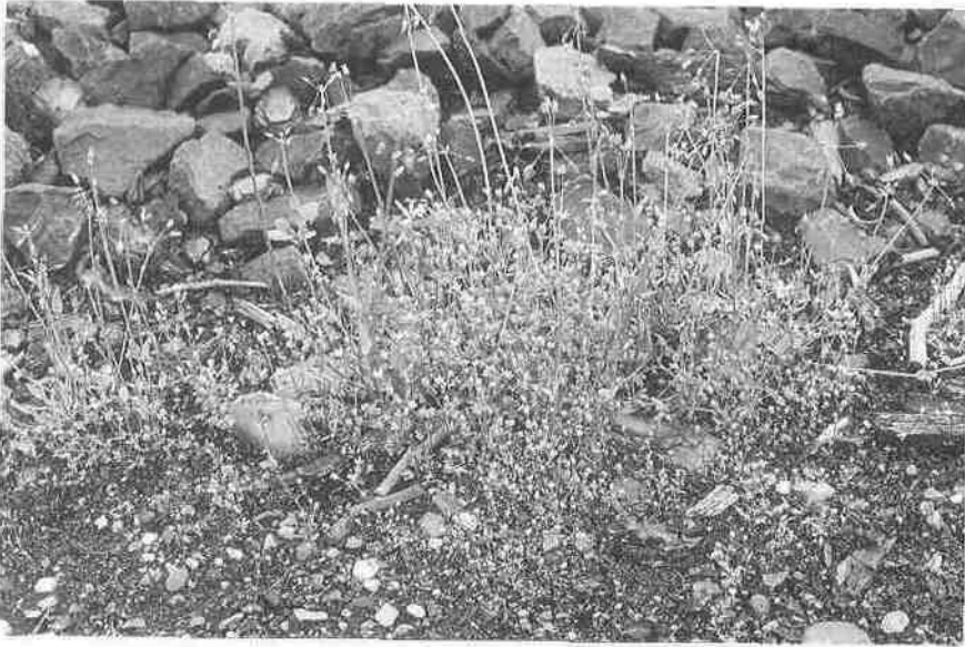
Abb. 4: Saxifraga tridactylites und Holosteum umbellatum auf Gleissand im Bahnhof Lüchow. April 1998.