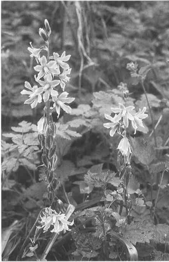
Abb. 2: Ornithogalum nutans unterhalb des Amtsturms. Mai 2001.

Anemone ranunculoides Ballota nigra ssp. nigra Brunnera macrophylla Chaerophyllum temulum Chelidonium majus Galanthus nivalis Galium aparine Geum urbanum