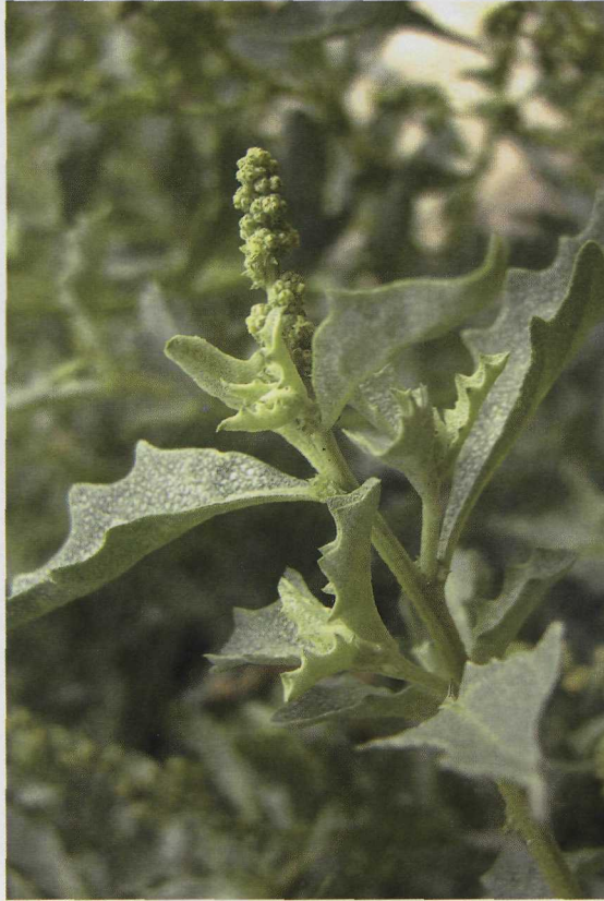
Abb. 1: Habitus von Atriplex semilunaris.

gezähnt, meist zu zweit (mitunter zusammengewachsen) und stehen nahezu rechtwinklig zueinander. Abb. 2 zeigt verschiedene Vorblätter einer 2003 auf Fuerteventura gesammelten Pflanze. Anfang November blühten dort die Pflanzen, zeigten aber auch schon ausgewachsene Vorblätter mit nahezu reifen Samen. Später trocknen die Vorblätter an der Pflanze ein und fallen durch ihre kräftig gelbbraune Färbung auf, wie Beobachtungen aus dem Februar zeigen.