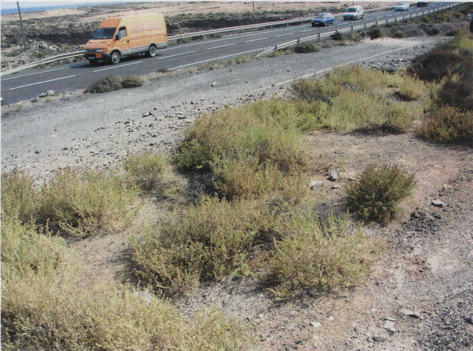
Abb. 5: Atriplex semilunaris an einer Ausweichstelle an der FV-2 (Foto: D. Brandes 2004).

Atriplex semilunaris wurde am 1.11.2003 auf Fuerteventura in der Ortschaft Casas de la Salinas entdeckt. Hier wuchs die Art ruderal zwischen einer asphaltierten Straße und einem unbefestigten Weg vor einem Baugrundstück. Unmittelbar vergesellschaftet war die Art mit der ebenfalls aus Australien stammenden Atriplex suberecta , benachbart wurde ein Bestand von Mesembryanthemum nodiflorum gefunden. Unabhängig davon wurden große Bestände im Februar 2004 zwischen dem Flughafen von Puerto del Rosario und El Matorral entlang der Hauptstraße FV-2 gefunden. Darüber hinaus kommt die Art entlang der FV-2 häufiger an Ausweichstellen vor, ebenso bei Pozo Negro hinter dem niedrigen Strandwall auf mehr oder minder ruderalisierten Flächen. Im Inselinneren fand sich die Art in Toto bei Pajara auf dem Gelände eines zerfallenen Hofes. Vermutlich hat sich Atriplex semilunaris längst über die ganze Insel ausgebreitet; alle vermeintlichen Atriplex suberecta -Bestände sollten daher kritisch überprüft werden. Atriplex semilunaris zeigt damit eine ähnliche Ausbreitungsdynamik wie Maireana brevifolia , eine andere Chenopodiacee australischer Herkunft (BRANDES 2002).