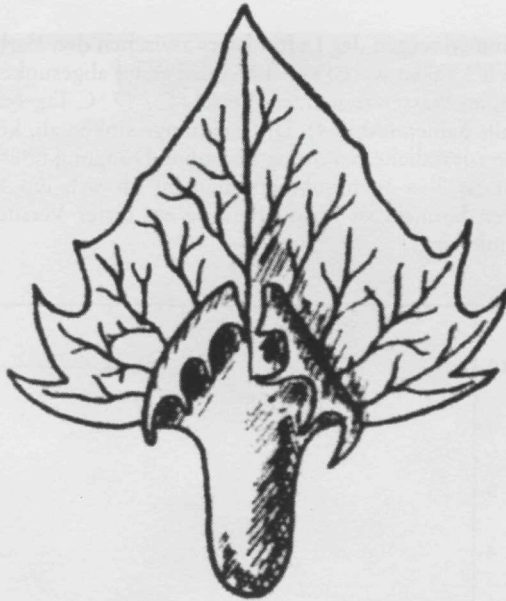
Abb. 3: Vorblatt von Atriplex semilunaris (aus AELLEN 1937/38).