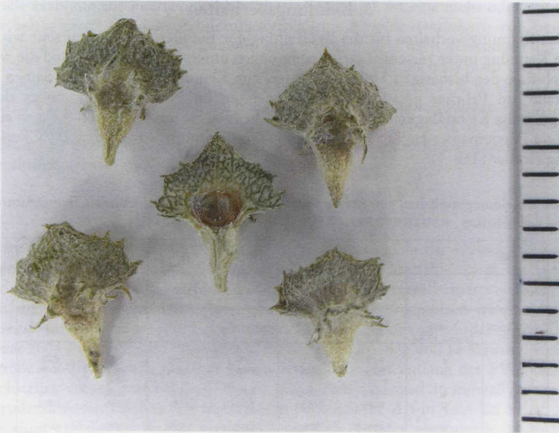
Abb. 2: Vorblätter von Atriplex semilunaris.